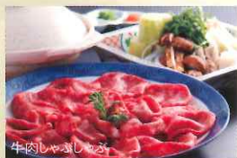
牛肉しゃぶしゃぶ